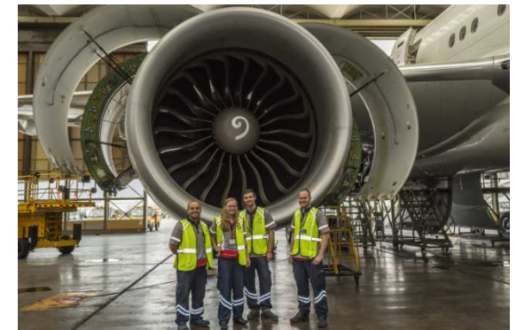
Istanbul 2014 – Atatürk-Flughafen – Turkish Technic

Während der Ausbildung sind geförderte Auslandspraktika möglich (EU-Programm ERASMUS+).